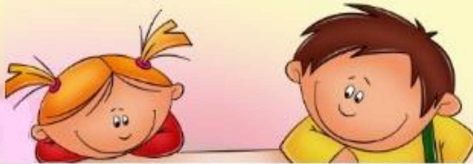
Лэпбук «Ребёнок и другие люди»